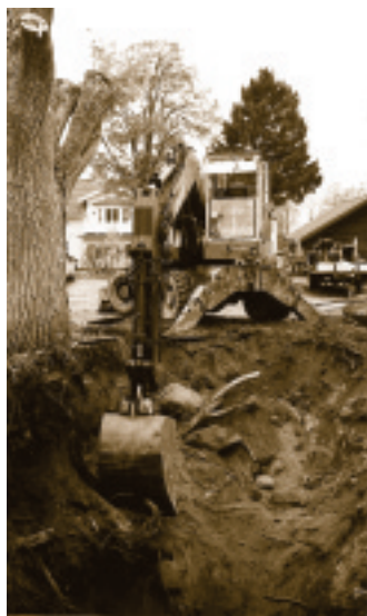
Östen Thoresson grävde fram gruvöppningen 4,5 meter under eken

Pengarna från Leader+ räckte till att gräva fram gruvöppningen, en 4x4 meter timmerinramad öppning i berget. Timret daterades till omkring år 1800. Med hjälp av slamsugare från Rolba i Hedesunda började schaktet tömmas. En del stora stenar fick sprängas och lyftas.