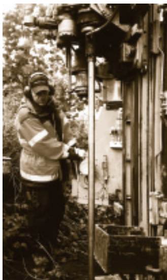
Provboringen vid eken visade på ett 18 meter djupt gruvhål