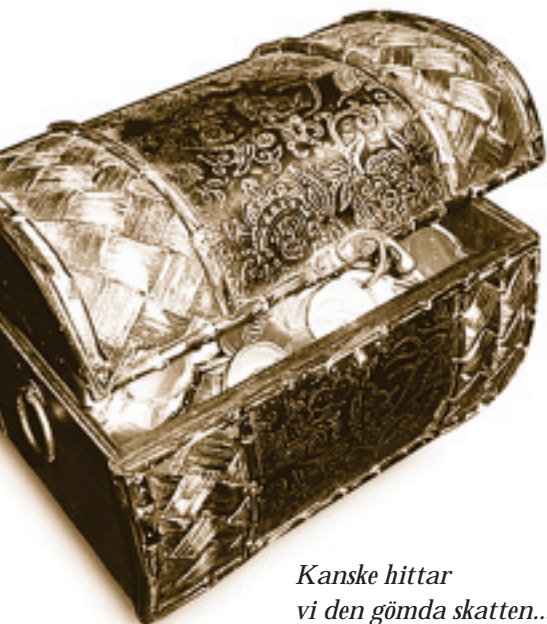
Kanske hittar vi den gömda skatten...

En spiraltrappa från marken ska ge en säker nedstigning i berget.