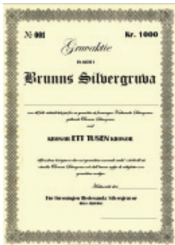
Gruvaktie i Brunns Silvergruva