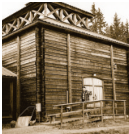
Turistanpassad gruvlave i Los historiska koboltgruva

Intill gruvlaven byggs en turistinformation med försäljning av souvenirer och hantverk, gärna silversmide. Ett bildspel planeras som berättar historien om gruvan.