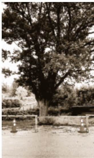
Eken beräknas vara cirka 150 år gammal

Med finansiering från Leader+, Nedre Dalälven gjordes provborrningar i augusti 2004 som indikerade ett gruvhål under eken.